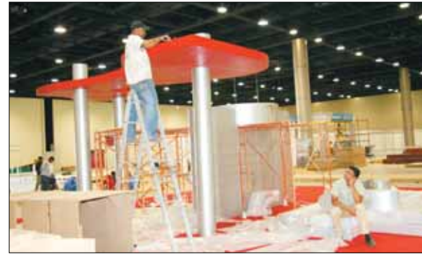
جانب من الاستعدادات للمعرض

وتوقع الحلبي ان يزور المعرض خلال ايامه الاربعة ما يقارب 25 الف زائر، مشيرا الى ان اغلب الزائرين هم من رجال الاعمال القطريين والخليجين، الى جانب الافراد الذين يتطلعون الى امتلاك شقق فاخرة في المشاريع العقارية العملاقة. تفاصيل من 8